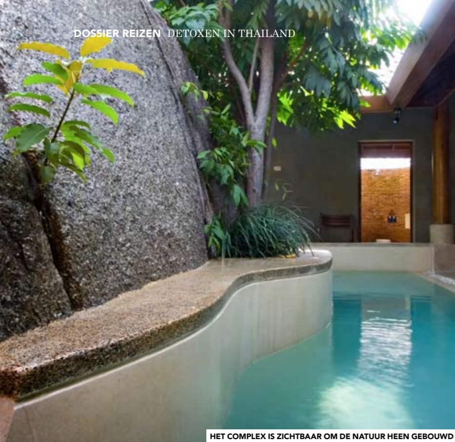
HET COMPLEX IS ZICHTBAAR OM DE NATUUR HEEN GEBOUWD